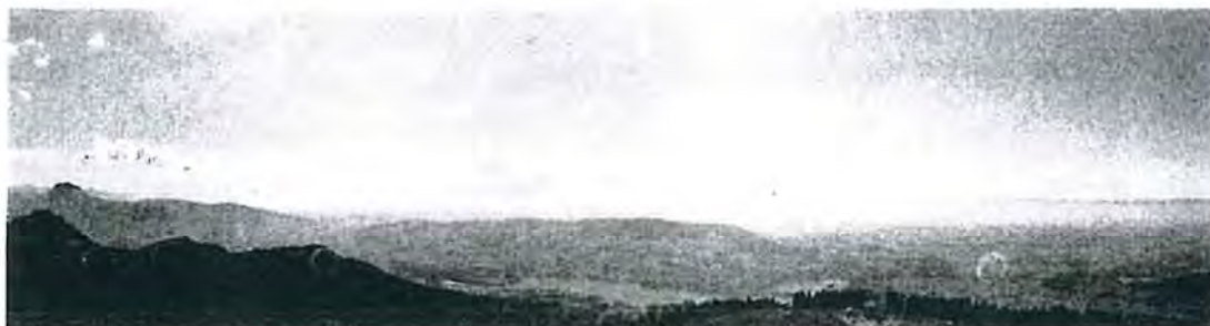
@ennova - Vue sur le Lac de Gruyère depuis la Berra

ETUDES ET RAPPORT DE PRIORISATION DES SITES ÉOLIENS